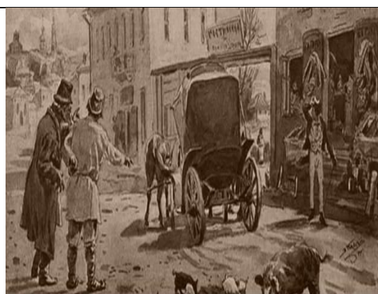
2. В.Е. Маковский. Н.В. Гоголь «Мертвые души» (Спор о том, доедет ли колесо и куда оно доедет)