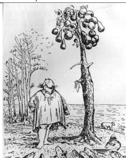
4. Кукрыниксы. М.Е. Салтыков-Щедрин «Повесть о том, как один мужик двух генералов накормил»