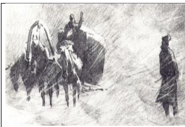
1. С.В. Герасимов. А.С. Пушкин «Капитанская дочка». Глава «Вожатый»

Задание 2. Рассмотрите репродукции картины известных русских художников, иллюстрирующие хорошо знакомые вам классические произведения. Определите, какое произведение проиллюстрировал художник. Какие герои или эпизоды запечатлены на картинах. (10 баллов)