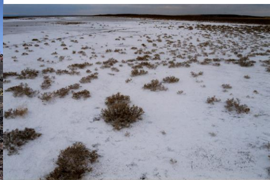
..... Солонцы/Солончаки .....