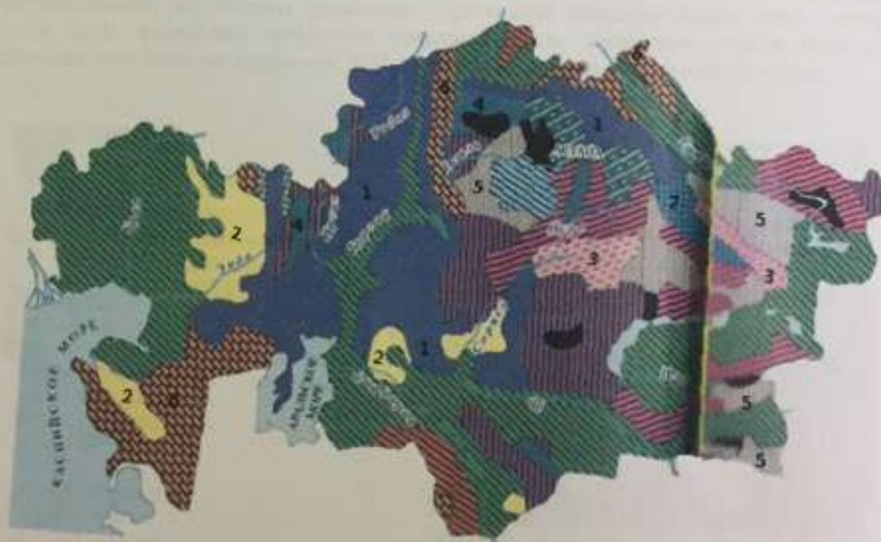
Сурет 1 – Қазақстанның геологиялық картасы

3) 2-суреттегі колденен тік қимадағы катпарлар түрлерін олардың атауларымен сәйкестендіріңдер – қорап тәріздес, сұлама, төңкерілген, тік, изоклиналды, флексура, тарак тәрізді, көлбеу, өткір-бұрышты; желпуіш тәрізді