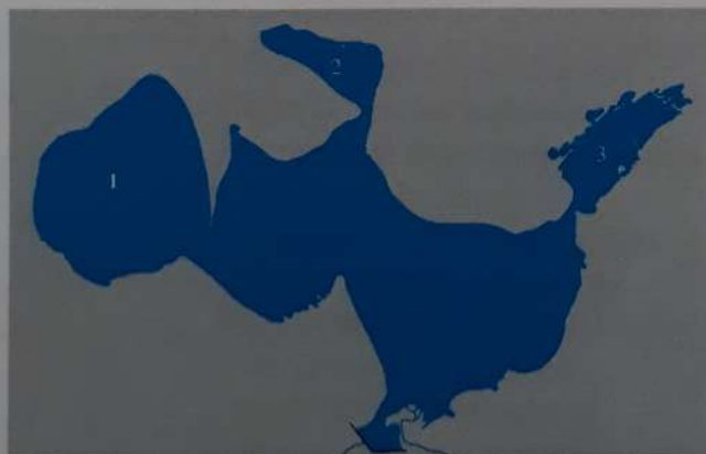
Сурет 1 (2010жыл)

1 және 2 суреттерде Қазақстандағы 2 ірі көлдердің контуры көрсетілген. 1-суретте «1», «2» және «3»; 2-суретте «5», «7» және «9» сандарымен берілген көлдердегі географиялық объектілердің атауын анықтаңыз.