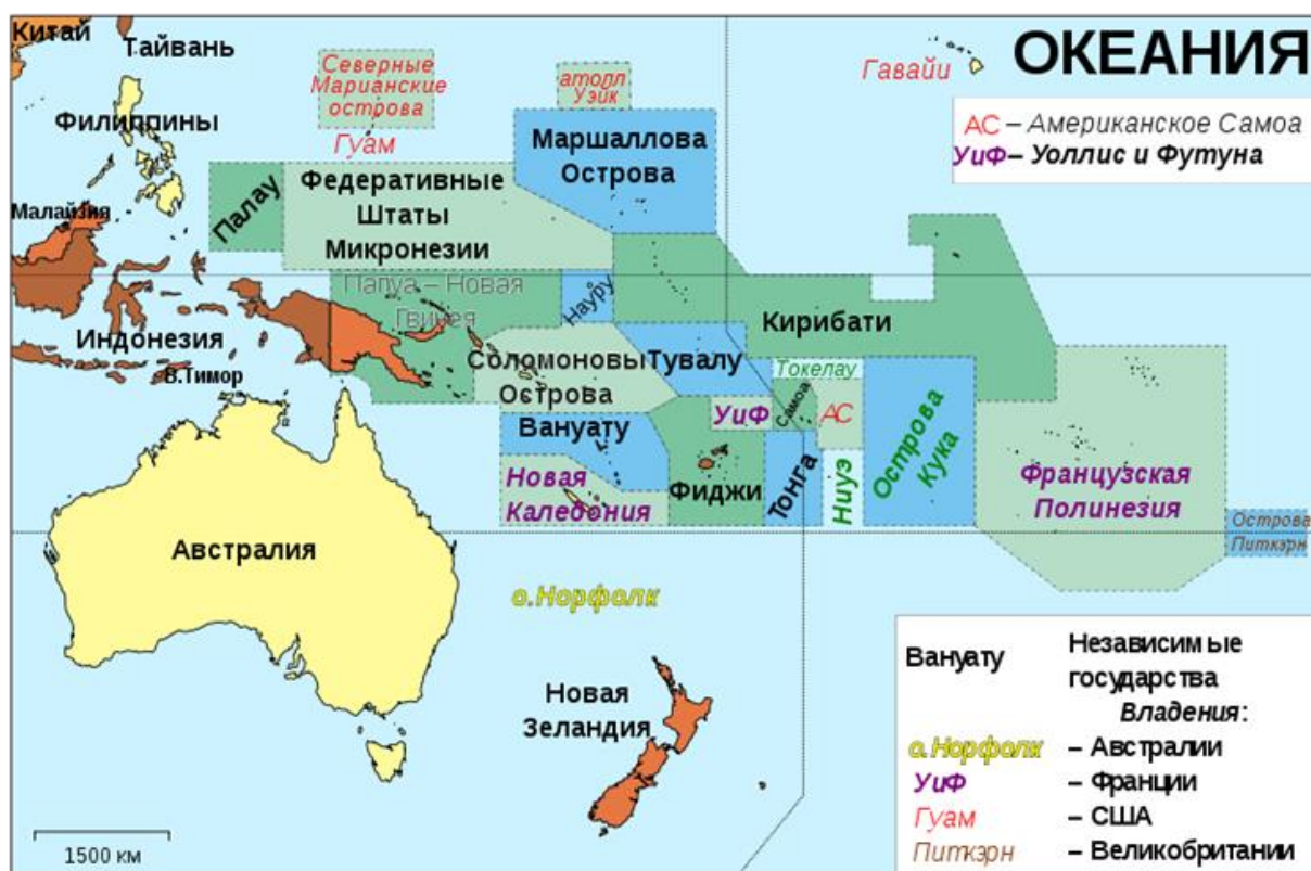
Рисунок 2 – Карта Океании и Австралии