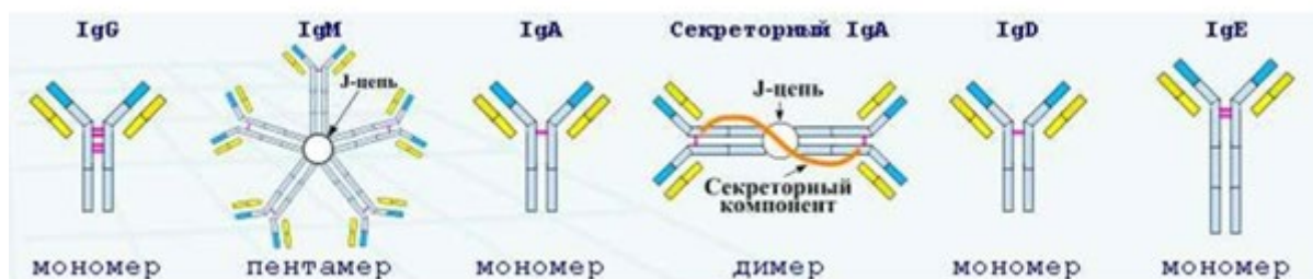
Рисунок 1. Классы антител человека

Наша иммунная система вырабатывает 5 классов антител: IgG, IgM, IgA, IgE и IgD (рис.1), мы рассмотрим 3 из них.